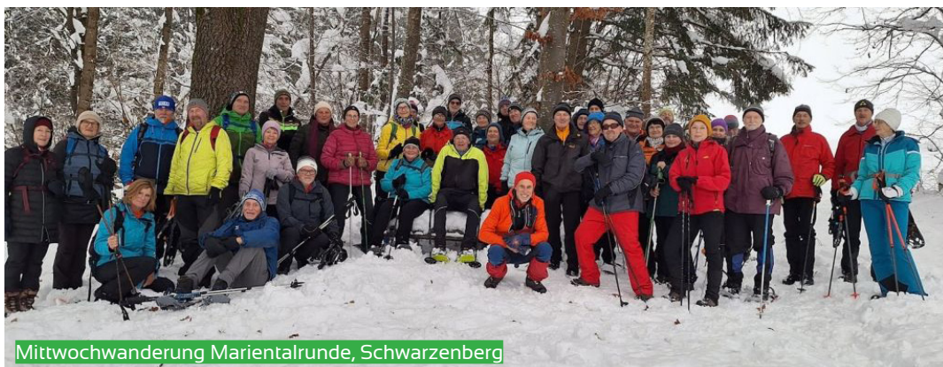
Mittwochwanderung Marientalrunde, Schwarzenberg

Egal ob beim Schlauchbootfahren auf der Gr. Mühl, beim Schifahren am Hochficht oder in den "großen" Bergen, beim Wandern irgendwo im Wald oder Gestein – die Natur und das Abenteuer, das in ihr steckt, zogen mich von klein auf an. So kam ich schon als Kind mit dem Klettern, insbesondere im Rohrbacher VS-Turnsaal, in Berührung.