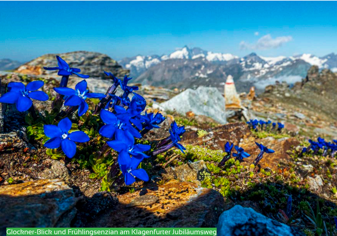
Glockner-Blick und Frühlingsenzian am Klagenfurter Jubiläumsweg

Mitteilungsblatt für AV-Mitglieder, März 2024