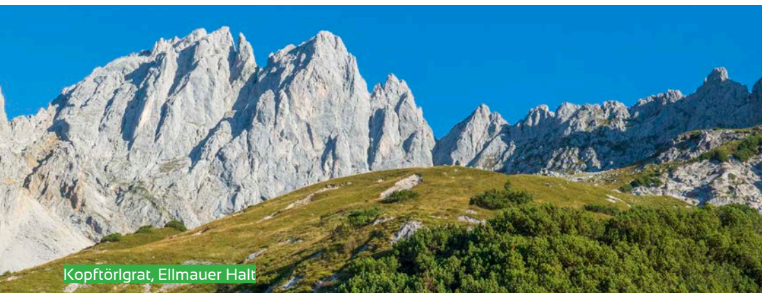
Kopftörlgrat, Ellmauer Halt