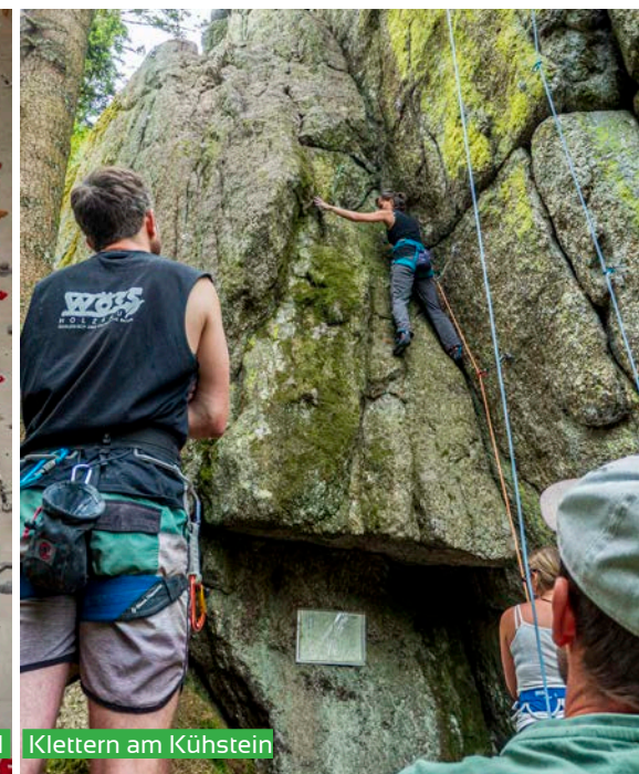
Klettern am Kühstein