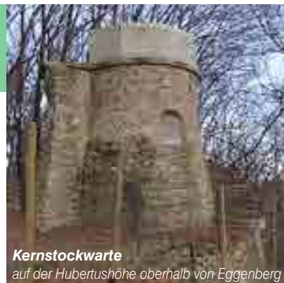
Kernstockwarte auf der Hubertushöhe oberhalb von Eggenberg