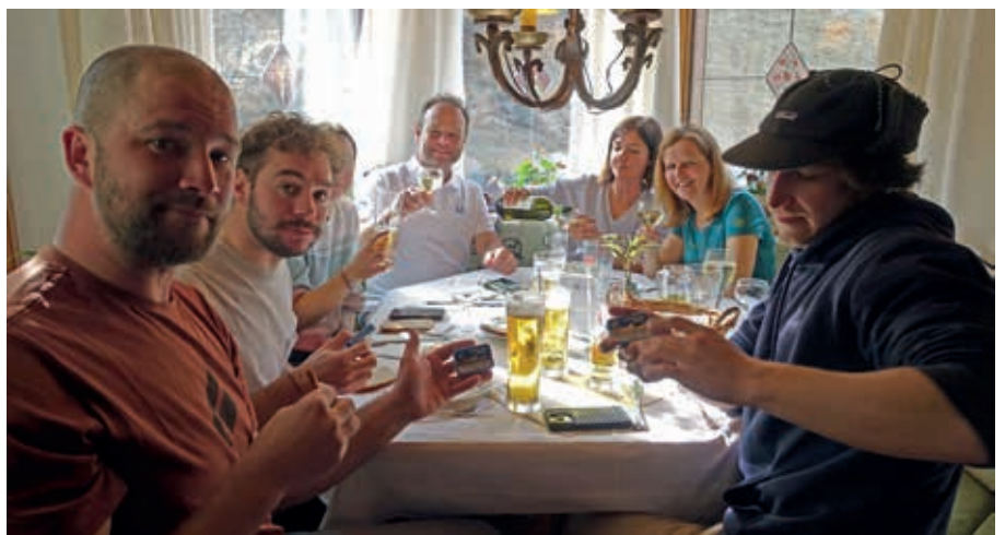
Gemütlich im Hotel