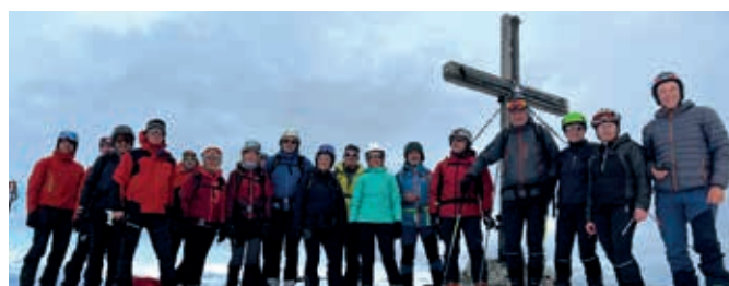
Silvester – Hoher Zinken