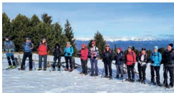
Schneeschuhtour Hohe Ranach

Schwierigkeitsbewertung wie beim ÖAV Judenburg !!!