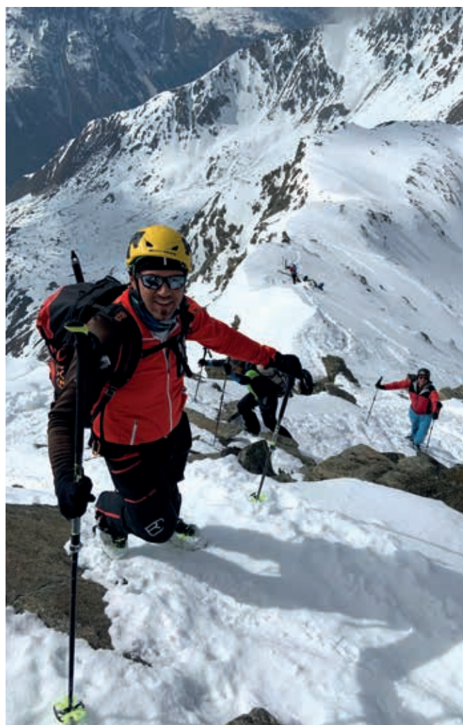
Gipfel & Gipfelgrat der Kuhscheibe (3188m)