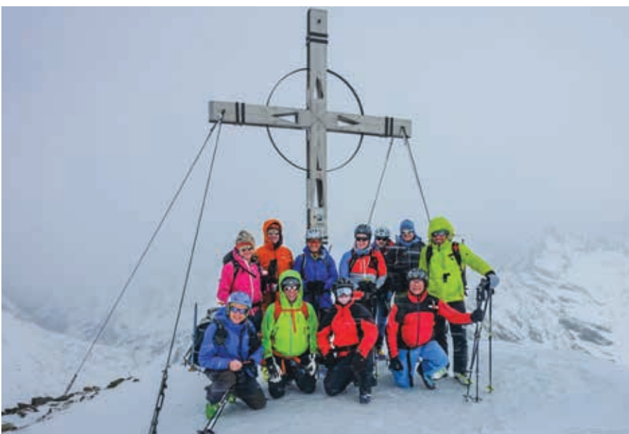
Hinterer Daunkopf (3225m)