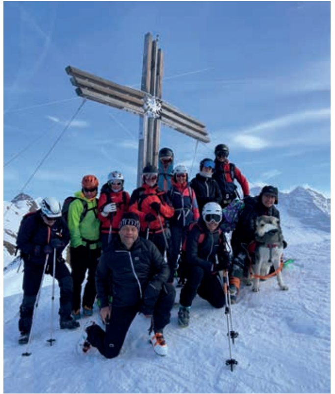
Gammerspitze 2537 m