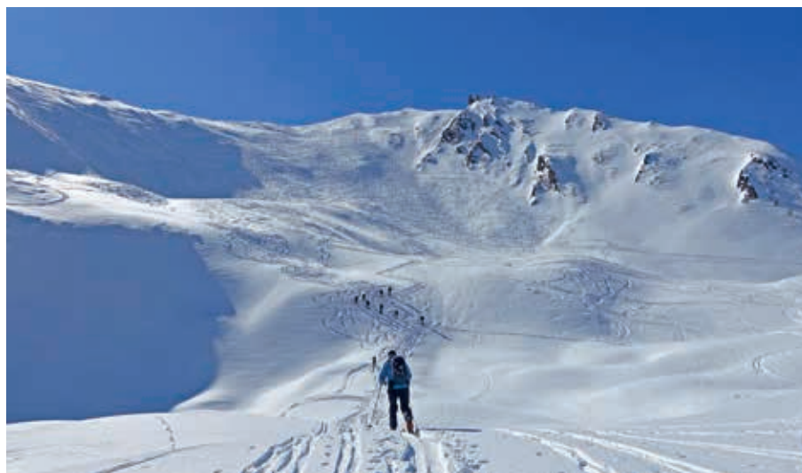
Hohe Warte 2422 m

Bis Dienstag blieben wir im Brenner-Gebiet vom wechselhaft angekündigten Wetter verschont und konnten schöne Touren durchführen. Trotz kräftigen Windes und schlechter werdender Sicht bestiegen wir am Mittwoch den Grubenkopf in Obernberg. Aufgrund des wechselhaften Wetters im Wipptal entschlossen sich einige am Donnerstag, ins nahegelegene Ratschingstal nach Südtirol auszuweichen. Mit anfangs leichtem Regen im Tal und Schneefall in den höheren Lagen konnte die Kleine Kreuzspitze (2518m) bestiegen werden. Mittags besserte sich das Wetter in Südtirol, und so konnte die Gruppe die Abfahrt bei sehr guten Tourenbedingungen genießen. Im Wipptal hingegen regnete es bereits in den Morgenstunden stark, wodurch die geplante Tour nach mehrheitlichem Beschluss abgesagt wurde.