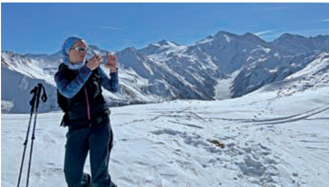
Blick zum Kleinen Kaserer