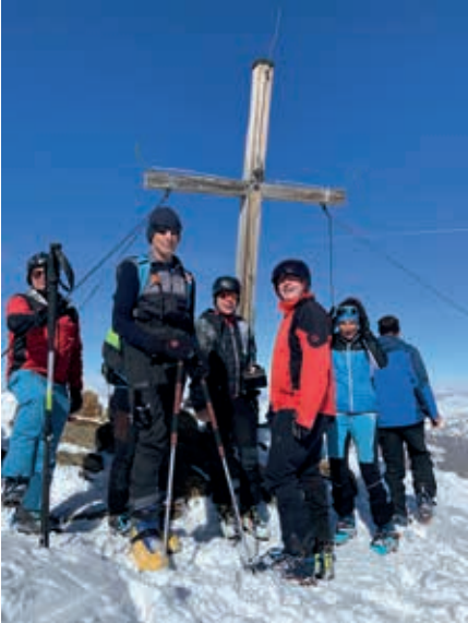
Kleiner Kaserer 3093 m