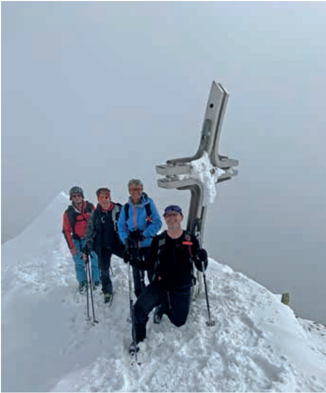
Kleine Kreuzspitze 2518 m