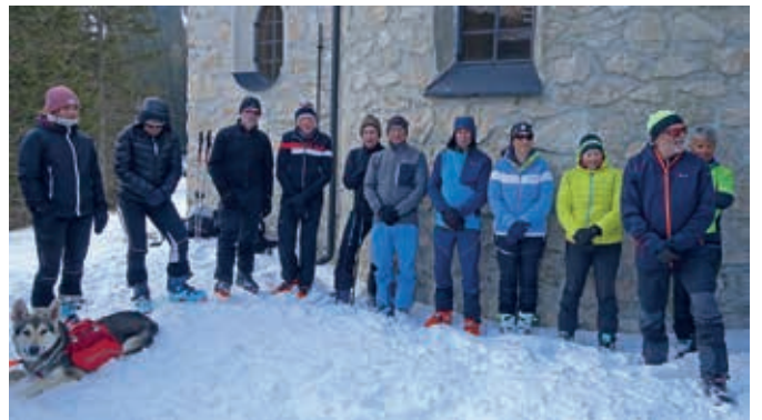
Andacht bei der Kapelle Maria am See