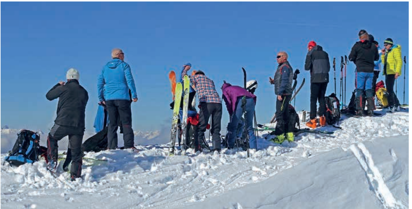
Am Gipfel der Hohen Warte