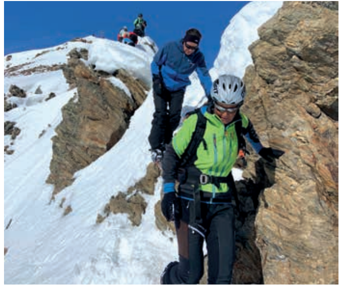
Abstieg vom kleinen Kaserer