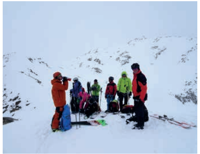
Wütenkarsattel (3103m) – Umkehr beim Windacher Daunkogel (3348m)